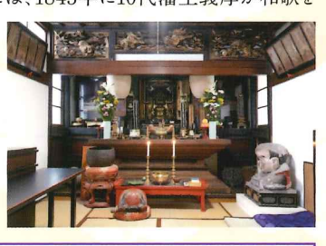
久保田城内にあった 阿弥陀堂

大本山百萬遍智恩寺33世幡随意的の弟子であった文岡が開山。土崎湊に庵を結んでいたが、1605年、義宣の外護により現在地に一字を創建した。堂内には、1843年に10代藩主義厚が和歌をしたため、刀番根田秀備が描いた「三十六歌仙絵」がある。