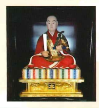
行学院日朝上人像に 眼病守護の折願を

1502年、本山本満寺の塔頭玉持院の住職日尋が土崎湊に開創。秋田県最古の日蓮宗寺院で、通称「浜の法華寺」と呼ばれた。その後、義宣の城下町づくりの一環で寺町に移転した。