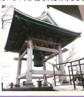
毎年大晦日につかれる梵鐘

鎌倉幕府7代將軍惟康親王の命により、妙覚寺、光明寺とともに開創。その後、義宣の城下町づくりの一環で寺町に移転した。9代藩主義和には自筆の木額「海無量」を賜るほど深く帰依された。秘仏の本尊「十一面観音立像」は秋田県指定有形文化財。