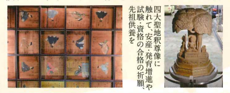
天井に描かれて いる三十六歌仙

1505年、下総国(千葉県)の中山法華経寺7世日有が土崎湊に開創。1605年頃、義宣の城下町づくりの一環で寺町に移転した。1679年、総本山身延山久遠寺29世日蓮が幕府の命で3代藩主義処にお預けとなり、随従した弟子らが久城寺に庵居。日蓮が亡くなった後、その弟子の1人日晴が久城寺11世となり、御霊屋と石塔を守った。