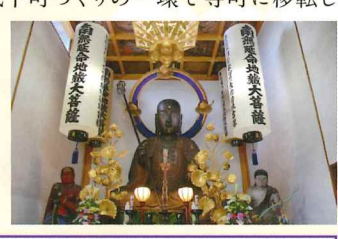
北秋田市「鎌沢の大仏」、 由利本荘市「赤田の大仏」と ともに、県内三大大仏と 言われている「延命地藏尊」

1283年、鎌倉幕府7代將軍惟康親王が命じ、高清水の丘に天台宗寺院(妙覚寺、光明寺、大悲寺)を創建。通称「土崎湊3カ寺」と呼ばれた。1556年、廃寺となったが、1591年に曹洞宗寺院として再興。1622年、義宣の城下町づくりの一環で寺町に移転した。本尊は住職一代に一度のみ開帳される秘仏。