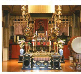
秘仏の大聖不動明王尊を 記る内陣

義宣の国替の際、追従した武将宥玄が開山。本尊の不動明王坐像は鎌倉時代の名工運慶の作品と言われており、弘法大師坐像、胎藏界曼荼羅一幅とともに秋田市指定文化財である。また、東北三十六不動尊霊場の1つで、除災招福の秘法「護摩祈祷」も行う。