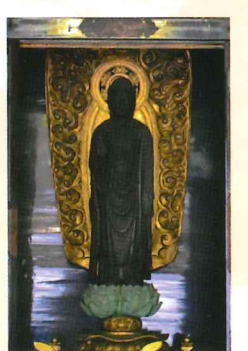
伝 北条時頼持仏釈迦如来像

鎌倉幕府5代執権北条時頼が開創。唐茶御前伝説によると、諸国修行の旅で津軽を訪れた時頼が寵愛していた唐茶御前の死を知り、鎌倉へ帰る道すがら供養のために建立した。1922年、秋田座の火事で本堂を焼失したが、1932年、千秋公園にあった佐竹家別邸大広間を移築し本堂とした。