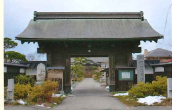
久保田城の裏門だった 楼門を改修・移築した山門

額田義直(佐竹家5代当主長義の弟)が常陸額田(茨城県)に開創。佐竹義宣の国替の際、住職鯨室樹瑞が義重(義宣の父)と一緒に秋田へ下り仙北郡六郷に創建した。その後、保徳院(義重の孫)は2代藩主義隆より拝領した現在地に寺院を移して佐竹一門の菩提を弔った。