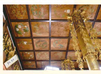
天井に描かれている 二百枚の植物絵

1560年に妙光院日銀が開創した、総本山身延山久遠寺の直系寺院。1765年、火災で本堂を焼失したが、1770年に久遠寺より本尊を拝受し再建。境内には身延山分体願満稲荷明神と加藤清正公を合祀したお堂や、日蓮聖人幼少時の善日磨立像がある。