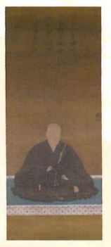
北陸から持参した教如 (東本願寺開基)の寿像

加賀国(石川県)の豪族矢田三郎時泰が開創。石山合戦で石山本願寺に加勢したが、織田信長の北陸攻めを機に一族で土崎湊に移り、1578年一字を建立。1683年、寺町に移転した。8代藩主義教には佐竹家の家紋の使用を許された。最澄制作と伝えられる阿弥陀如来画像を所蔵。