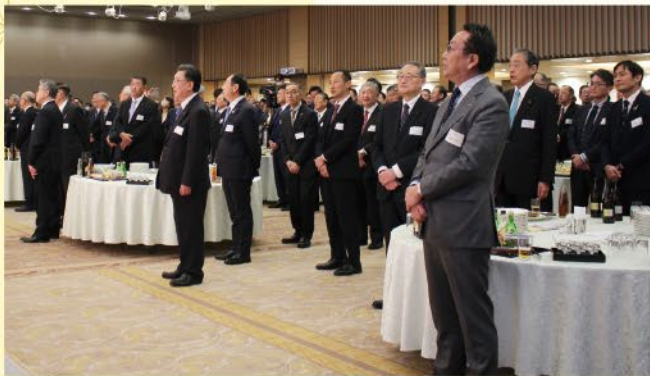
佐竹敬久知事 祝辞