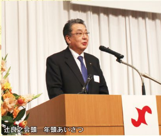
社良之会頭 年頭あいさつ