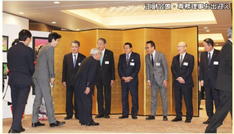
正副会頭・専務理事お出迎え