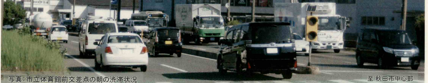
写真：市立体育館前交差点の朝の渋滞状況