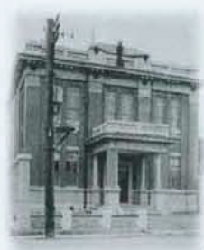
昭和初期頃の 秋田商工会議所

平成29年に創立110周年を迎える当所は、今後も会員企業の皆様と地域社会の期待と信頼にお応えできるよう、きめ細かな取り組みを展開してまいります。