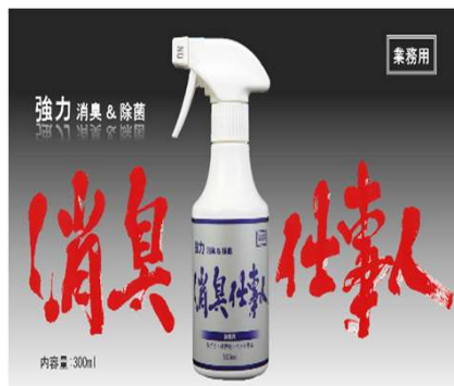
【キッチン・ゴミ集積所】