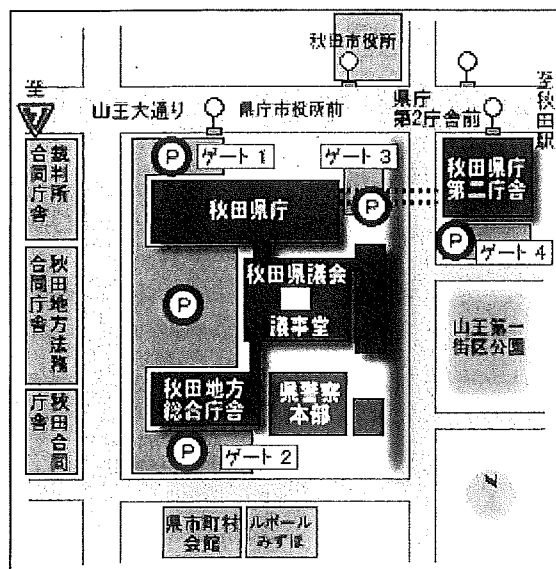
秋田県庁舎配置図